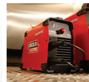
В ходе тестирования аппараты Invertec® 150S и 170S прошли испытания в экстремальных условиях окружающей среды.